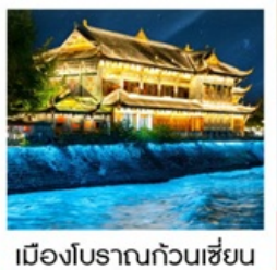
เมืองโบราณกวันเซียน