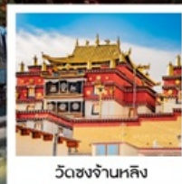
วัดชงจันหลิง