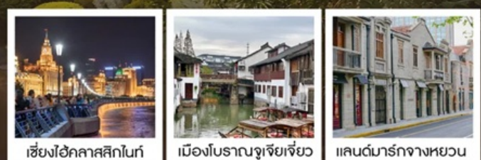
เซี่ยงไฮ้คลาสสิกไนท์

เซี่ยงไฮ้ คลาสสิก ไท่ / 3 ตึกใหญ่แห่งเซี่ยงไฮ้ ล่องเรือหมู่บ้านโบราณจูเจียเจี้ยว / EKA Tianwu / ถนนหวยไห่ วัดหลงหัวแลนด์มาร์ก จางหยวน / ซินเทียนตี้ / ชมโชว์ ERA ที่โรงละครโด่งดังระดับโลก