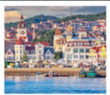
ท่าเรือประมงเหยียนโกะ