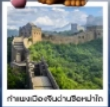
กำแพงเมืองจีนผ่านซือหม่าโต

เมืองโบราณกู่เป่ย์ซู่เจิ้น / กำแพงเมืองจีนด่านซือหม่าโต (รวมค่ากระเช้าขึ้น-ลง) / ชมวิวกำแพงเมืองจีนและเมืองโบราณ ยูนิเวอร์แซลปักกิ่ง (รวมค่าบัตรเข้า) / จัตุรัสเทียนอันเหมิน / พระราชวังโบราณฤดูร้อน / หอขงจื้อ คาเฟ่ทาน้ำเต้าหู้ (TANG FANG CAFE) / พระราชวังฤดูร้อนอวิ๋นเหอหยวน / ย่านชานหลี่ถุน (POP MART) / ถนนคนเดินไท่กุ่หลี่