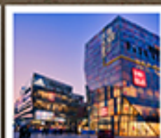
ย่านซานหลี่ตุ่น