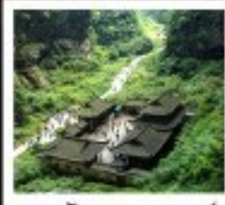
หลุมฟ้า สะพานสวรรค์

พระพุทธรูปทะเลสาบ / หมู่บ้านโบราณเมืองฮงชิ่ง อุทยานหลุมฟ้าสะพานสวรรค์ / รมิยงตระกวด / อุทยานเมฆาหวา ภูเขาโมโก / Wulong Flying Kiss / เข็มปักถนนคนเดินเฉิงฟางเฉิง เข็มปักหงหยาดัง / มหาศาลประชาชน / เข็มปักไฟฟ้าทะเลสาบ ถนนโบราณจีนแท้ / ศูนย์หมีแพนด้า