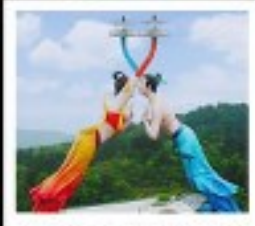
WULONG FLYING KISS