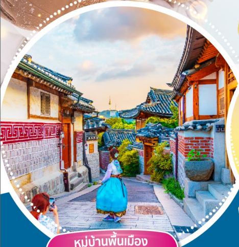
หมู่บ้านพื้นเมือง พูซอนอันนุก