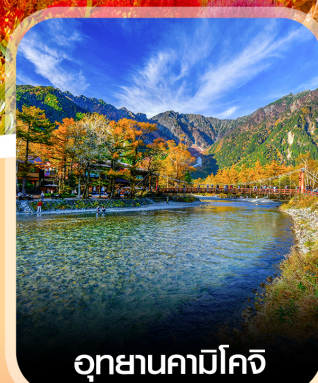
อุทยานคามิโคจิ