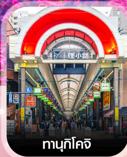
ทามุกิโคจิ

คอนเฟิร์ม ออกเดินทาง ทุกพีเรียด 2 ท่านขึ้นไป