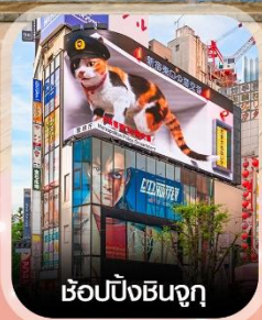
ซ้อปปิ้งชินจูกุ

✈️ คอนเฟิร์ม ออกเดินทาง ทุกพีเรียด 2 ท่านขึ้นไป