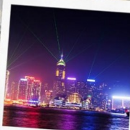
โชว์ SYMPHONY OF LIGHT