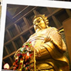
วัดเชกงงหมี