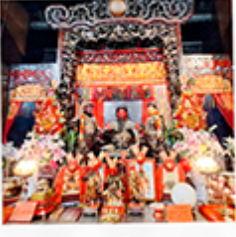
วัดเทพเจ้ากวนอู