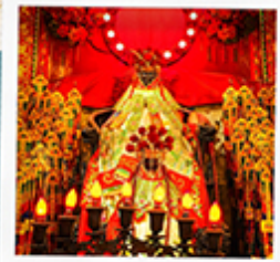
เจ้าแม่กวนอิมสองฮา