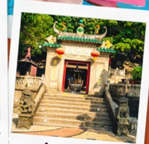
วัตอาม่า