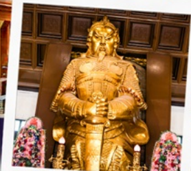
วัดเขากงหมิว