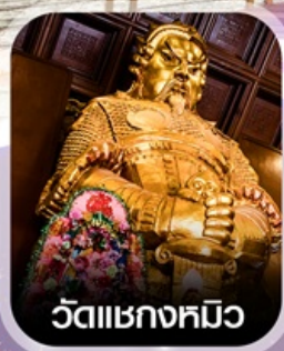
วัดเขกงมือ