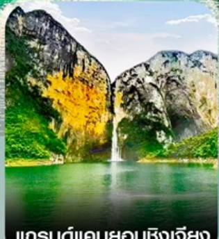
แกรนด์แคนยอนซิงเจี๋ย