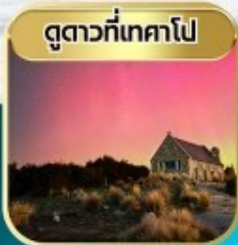
ดูดาวที่เทคาโป