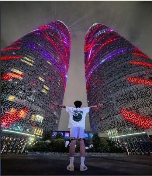
ตึกแฝดเทียนฟู่ (Tianfu International Financial Center Towers)