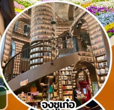
จงซูเก๋อ