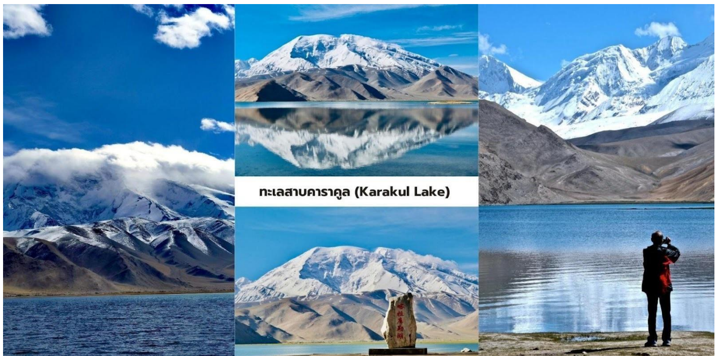
ทะเลสาบคารากูล (Karakul Lake)

นักท่องเที่ยวสามารถเดินชมทัศนียภาพรอบทะเลสาบและสัมผัสบรรยากาศธรรมชาติของที่ราบสูงปามีร์ที่เจียบสงบ ถือเป็นหนึ่งในจุดชมวิวกูเขาหิมะและทะเลสาบที่สวยงามที่สุดของเส้นทางสายปามีร์