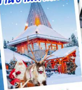
หมู่บ้านซานตาคลอส