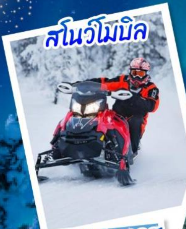
สโนว์โมบิล