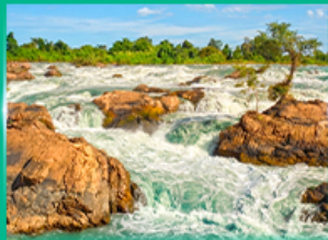
น้ำตกหลี่ผี