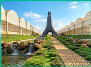
Agro Vege Farm