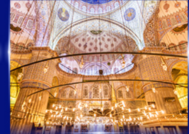
เข้าชมความงามสุเหร่าสีน้ำน้ยม