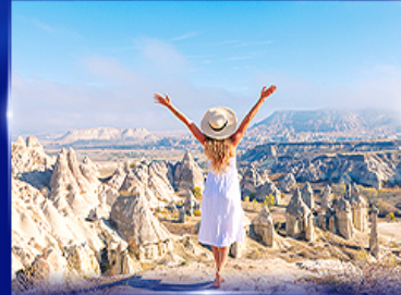
ชมความงดงาม หุบเขาแห่งรัก