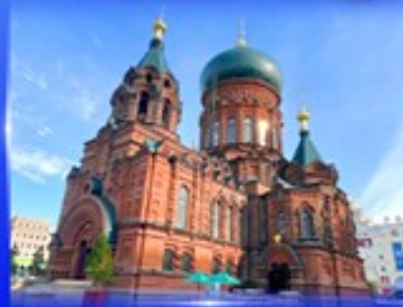
โบสถ์เซ็นต์โซเฟีย