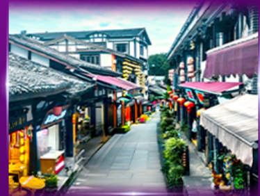
หมู่บ้านโบราณฉิวชี่ไถ่