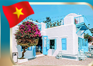
คาเฟ่สไตล์ชิคาโกริมน้ำ ชันตรา เทริน่า