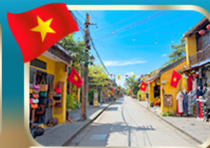
เที่ยวชมเมืองเก่ามรดกโลก ฮอยอัน