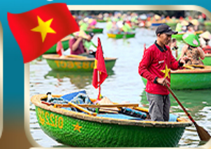
ล่องเรือกระด้ง ชมหมู่บ้านก๊วกทาน