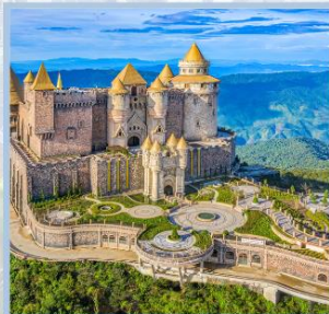
ปราสาทจันทรา