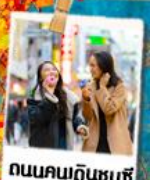
ถนนคนเดินชุนซี