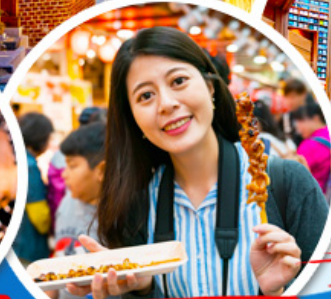
ตลาดควางจ้ง