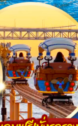
แถมฟรีนั่งรถราง