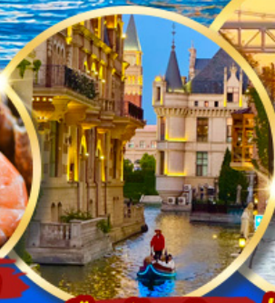
เมืองน้ำเวนิส