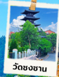
วัดชงซาน