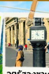
จัตุรัสจงซาน