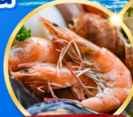
อาหารซีฟู้ด