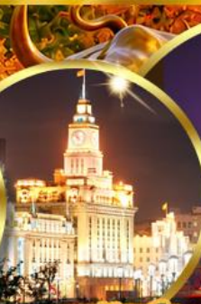
เดอะมันด์