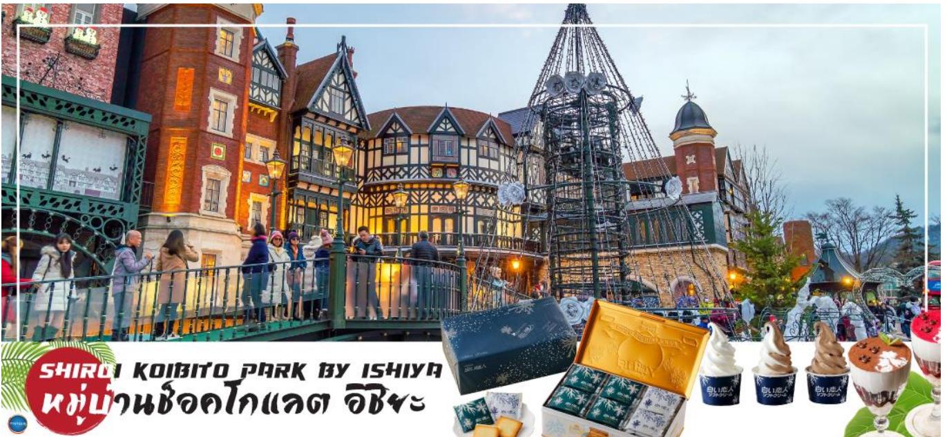
SHIROI KOIBITO PARK BY ISHIYA หมู่บ้านช็อคโกแลต อิชิยะ

จากนั้นนำท่านเดินทางสู่ เมืองซัปโปโร (SAPPORO) (ใช้เวลาเดินทางประมาณ 1.20 ชั่วโมง) นำท่านสู่ หมู่บ้านช็อคโกแลต อิชิยะ (Shiroi Koibito Park by Ishiya) (ด้านนอก) แหล่งผลิตช็อคโกแลตที่มีชื่อเสียงของญี่ปุ่น ตัวอาคารของ โรงงานถูกสร้างขึ้นในสไตล์ยุโรป แวดล้อมไปด้วยสวนดอกไม้ จึงทำให้บรรยากาศของหมู่บ้านช็อคโกแลตที่นี่ดูคลาสสิกและน่ารักไปอีกแบบ ช็อคโกแลตที่ขึ้นชื่อที่สุดของที่นี่คือ Shiroi Koibito ซึ่งมีความหมายว่าช็อคโกแลตขาวแต่คนรัก ท่าน