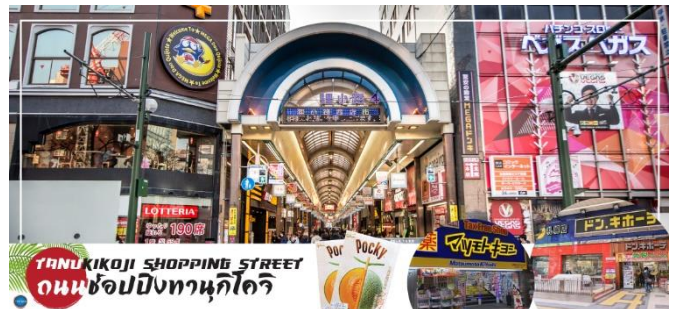
TANUKIKOJI SHOPPING STREET ถนนช้อปปิ้งทานุกิโคจิ

ร้านค้าต่างๆ อย่างร้านขายกิโมโน เครื่องดนตรี วิดีโอ โรงภาพยนตร์แล้ว ยังมีร้านอาหารมากมาย ทั้งยังเป็นศูนย์รวมของเหล่าวัยรุ่นด้วย เนื่องจากมีเกมเซนต์อร์ และตู้หนีบตุ๊กตามากมาย ร้านดองกิร้าน 100 เยน นอกจากนั้นที่นี่ยังมีการตกแต่งบนหลังคาด้วยตุ๊กตาทานุกิขนาดใหญ่ และเนื่องจากร้านค้าส่วนใหญ่มีหลังคาคลุม ดังนั้น ไม่ต้องกังวลเรื่อง ฝนหรือหิมะ ท่านสามารถช้อปปิ้งได้อย่างเพลิดเพลิน