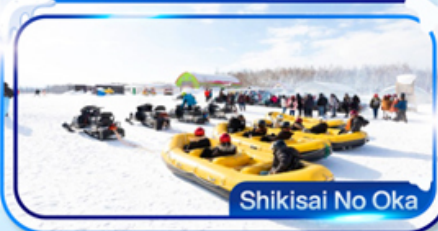
Shikisai No Oka