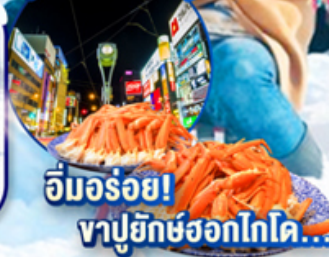
อิมมอร์อย! ซาปูยักซ์ฮอกไกโด...

ไฮไลท์!! สนุกสนาน ณ ลานสโนว์ เวิลด์ ซึคิโซพานิราม่า ผนังความสวยงาม วิจิตรตระการตา ณ พิพิธภัณฑ์หิมะ-ไอซ์พาร์วิลเลียน เดินชม คลองโอตารุ ในบรรยากาศสุดแสนโรแมนติก ช้อปปิ้งจุใจ อีออน เมืองอาซาฮิกาว่า และ ย่านซูซุกิโนะ อิมมอร์อย! ซาปูยักซ์