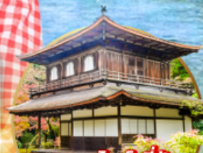
ชมสวนสไตส์ญี่ปุ่น.. Ginkakuji Temple

ไฮไลท์!! คาบิโคจิ หุบเขาใบฝืนที่อยู่สูงขึ้นไปทางเหนือแอลป์ ชมสวนสไตส์ญี่ปุ่น และเยือน วัดกินคะคุจิ หรือ วัดเงิน สัมผัสวัฒนธรรมดั้งเดิมของชาวญี่ปุ่น เรียนพิธีชงชาญี่ปุ่น (Sado) พร้อมเชคอิน ย่านซาคาเอะ จุดศูนย์กลางแหล่งรวมความบันเทิง ช้อปปิ้งจู่ใจ ณ แจซ ตรีม เฮ้าท์เล็ก ของเมืองนาโงย่า