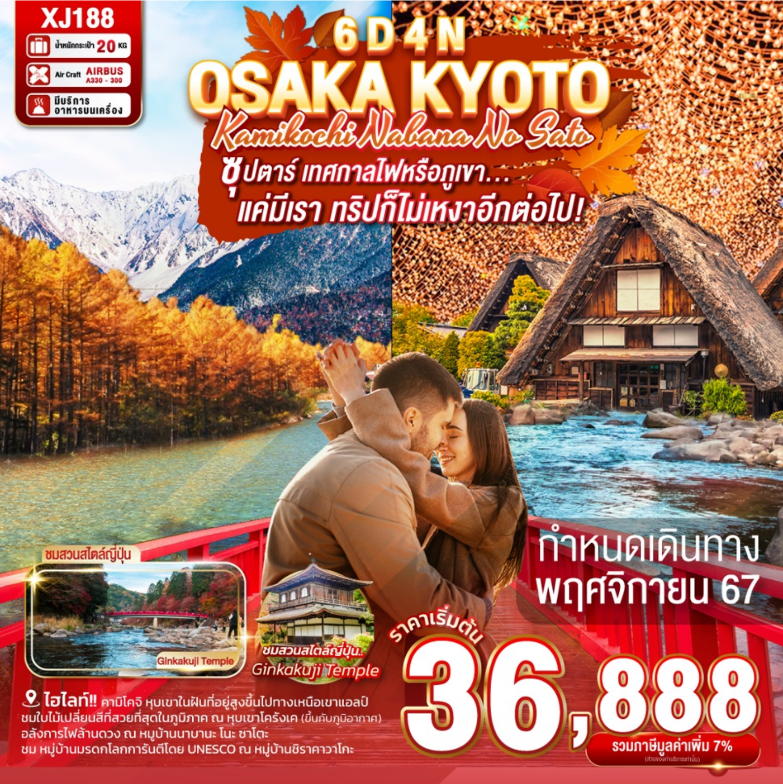
ชมสวนสโตนี่ญี่ปุ่น

ชูปตาร์ เทศกาลไฟหรือภูเขา... 'แค่มีเรา ทรัพย์สินก็ไม่เหงาอีกต่อไป!