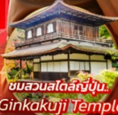
ชมสวนสโตนี่ญี่ปุ่น... Ginkakuji Temple