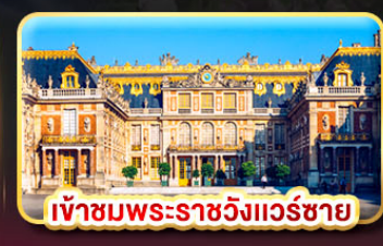
เข้าชมพระราชวังแวร์ซาย