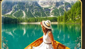
พายเรือทะเลสาบ Braies