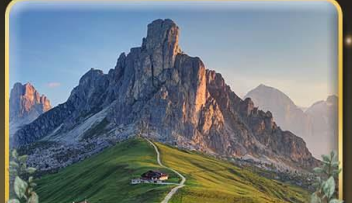
เยือน Passo Giau