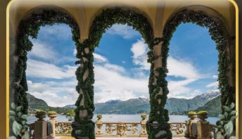
เชคอิน Villa del Balbianello

ที่สุดของธรรมชาติแห่งอิตาลี ทิวเขา ทะเลสาบ ความงามแห่งโดโลไมท์