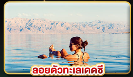
ลอยตัวทะเลเดคซี