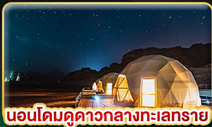
นอนโดมดูดาวกลางทะเลทราย

★ บินตรงสู่ "จอร์แดน" เยือน 7 มหัศจรรย์ของโลก