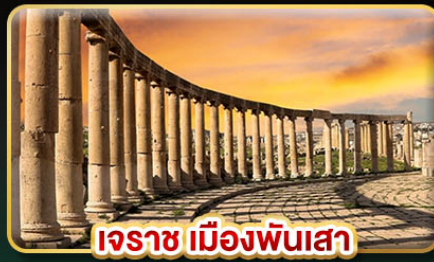
เอราซ เมืองพันเสา