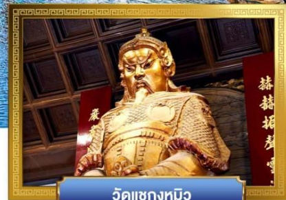
วัดเขangkหมิว