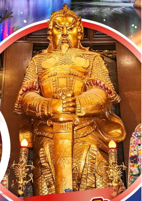
วัดเขกงหมิว