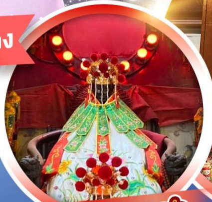
เจ้าแม่กวนอิมสองฮา

หมุนกังหันเปลี่ยนชีวิตวัดเขกง ซ้อปั้งจิมซาจ๋วย ขอพรเสริมความเฮงความบั่ง ยืมเงินเจ้าแม่กวนอิมสองฮา