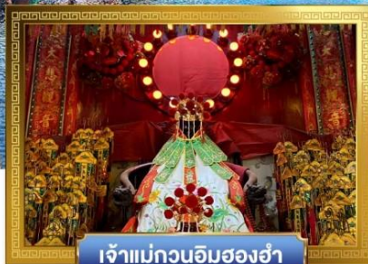
เจ้าแม่กวนอิมสองห้า