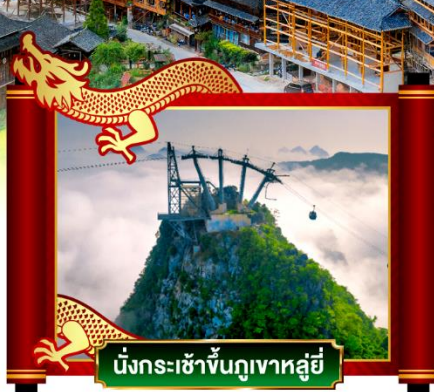
นั่งกระเช้าขึ้นภูเขาหลูอี้