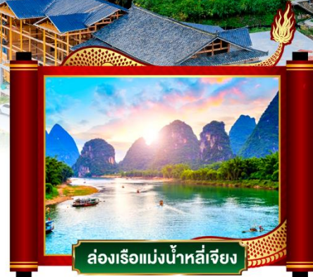
ล่องเรือแม่น้ำหลีเจียง