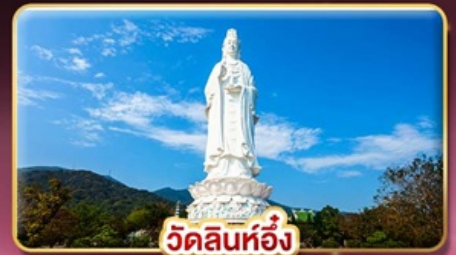
วัดลินห์อั้ง