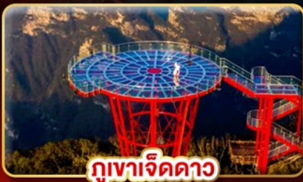
ภูเขาค็ดดาว