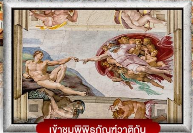
เข้าชมพิพิธภัณฑ์วาติกัน

เมนูพิเศษ! สปาเกตตี้เส้นหมึกดำ, พิชซ่าสไตล์อิตาลีเย็นแท้