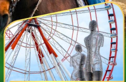
อนุสาวรีย์อาลีและนีโน่