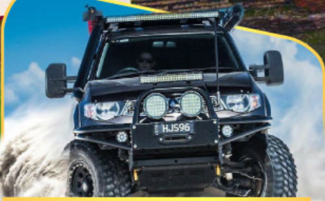
ขึ้นรถ 4WD สู้ใจกลางเทือกเขาคอเคซัส