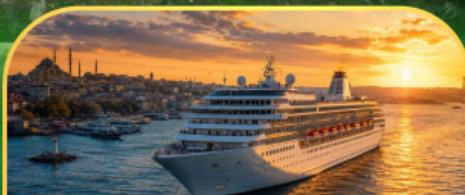
ล่องเรือทะเลดำ