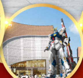
กินดื่ม ปาร์ค ฟุกุโอกะ