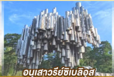
อนุสาวรีย์ซีเบลึส