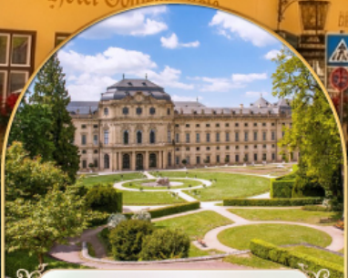
พระราชวังเวิร์ทซบวร์ค เรสซิเดนซ์