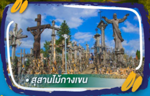
• สุสานไม้กางเขน