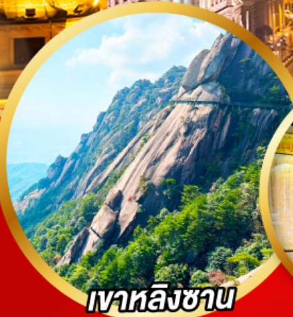
เว้าหลิงซาน